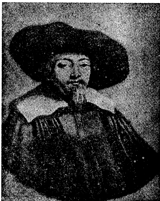
מנשה בן ישראל